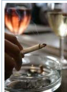
El consumo de tabaco ha generado un fuerte debate social.